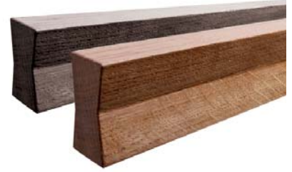
Sigma by Markus Bischof